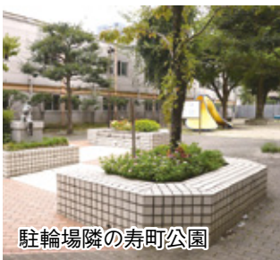
駐輪場隣の寿町公園

また、駐輪場の隣には寿町公園があります。地域の方から公園にもお花を植えてほしいとの要望があり、これに応じて余った苗を植えてい