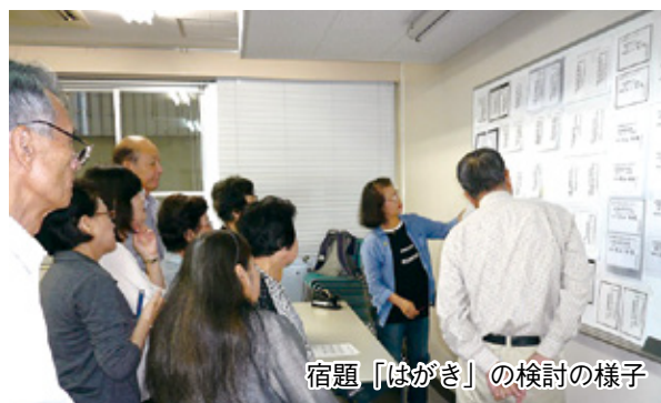
宿題『はがき』の検討の様子

『感謝状』の作品では、全体の枠内に縦横の中心を意識してバランスよく収めることや、縦のラインを意識し文章がうねらない様にするなどの指摘がありました。